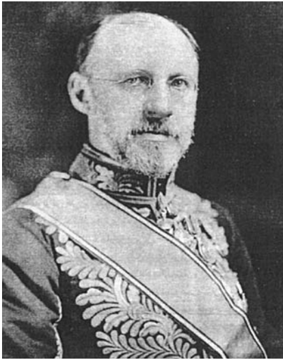
سرسیسل اسپرینگ رایس (وزیر مختار انگلیس در دربار ایران)

دیگری در سر راه آن پدیدار گردید و آن پیمان ۱۹۰۷ م. دو دولت روس و انگلیس بود. ۹