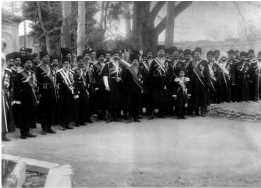
پل کونیک لیاخوف و صاحبمنصبان قزاق

مدارس، اقدامات عین‌الدوله، اخذ وام‌های متعدد از بیگانگان و سفرهای متعدد به خارج، رنجش مردم از موسیو نوز بلژیکی بیدادگری‌ها و خودکامگی‌های عین‌الدوله، اقدامات امین‌السلطان، پیمان گمرکی با روسها و تعرفه گمرکی، انتشار برخی آثار ۱ و عملکرد سردمداران حکومت ایران در ظلم و تعدی نسبت به توده‌های داخلی منجر به بیداری آحاد ایرانیان و در نهایت به انقلاب مشروطه در سال ۱۹۰۶ م. برابر با ۱۲۸۵ ش گردید.